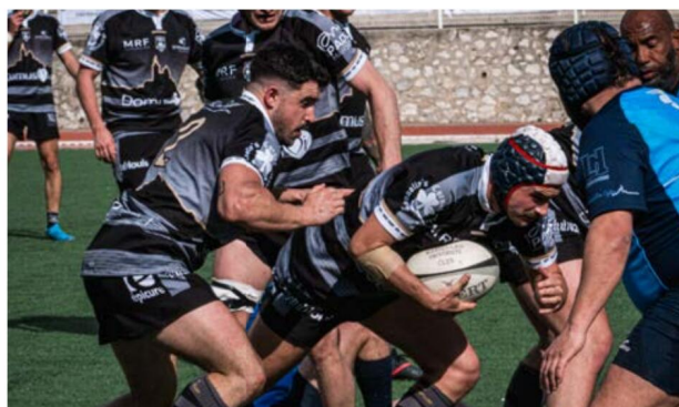
Les réservistes du Smuc sont éliminés.