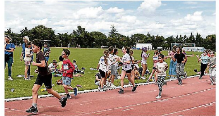
Les tours de piste se sont multipliés ce lundi 18 mai.

affaires scolaires et à la jeunesse. Le principe de la Course contre la Faim repose sur un système de parrainage : avant l'événement, chaque élève a sollicité ses proches : famille, voisins, amis, qui se sont engagés à verser un don proportionnel au nombre de tours accomplis. Une fois la course terminée, les élèves collectent ces promesses de dons auprès de leurs sponsors. Les fonds ainsi rassemblés par l'établissement seront reversés à l'association Action contre la Faim, sous forme d'un chèque remis à la fin de l'année scolaire. Cette année, les fonds collectés sont dédiés au Nigeria, pays confronté à une crise humanitaire profonde et multidimensionnelle. Près de la moitié de la population vit sous le seuil de pauvreté international.